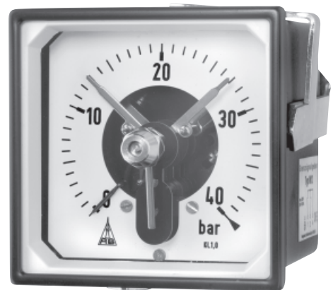
RQS 96-1, 40 bar, M12