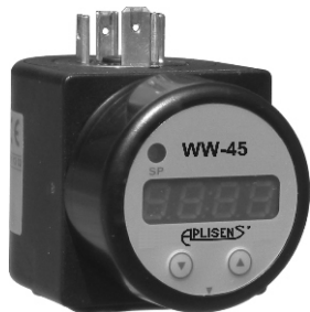
Индикатор PMS-11K (WW-45)