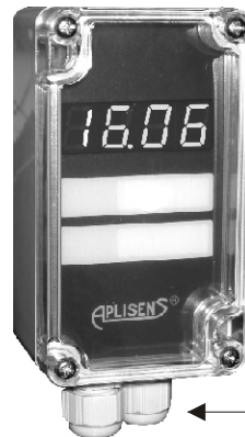
Индикатор PMS-11N Габаритные размеры 115×65×55

Индикатор PMS-11K предназначен для совместной работы с любым устройством, имеющим выходной сигнал (4 \div 20) мА и оснащенный на выходе стандартным штепсельным разъемом типа DIN 43 650. Основным применением указателя является совмещение местного контроля с дистанционным контролем измерения давления или разности давлений. Индикаторы PMS-11K имеют возможность конфигурации диапазона показаний от -999 до 9999 и позицию десятичной точки. Оснащены дисплеем LED (красным) с высотой цифр 7,62 мм, а также программируемым дискретным выходом типа открытый коллектор (OC). Индикатор не требует дополнительного питания.