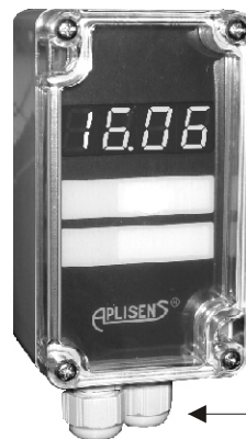
Индикатор PMS-11N Габаритные размеры 115×65×55

Индикатор PMS-11K предназначен для совместной работы с любым устройством, имеющим выходной сигнал (4 \div 20) мА и оснащенный на выходе стандартным штепсельным разъемом типа DIN 43 650. Основным применением указателя является совмещение местного контроля с дистанционным контролем измерения давления или разности давлений. Индикаторы PMS-11K имеют возможность конфигурации диапазона показаний от -999 до 9999 и позицию десятичной точки. Оснащены дисплеем LED (красным) с высотой цифр 7,62 мм, а также программируемым дискретным выходом типа открытый коллектор (OC). Индикатор не требует дополнительного питания.