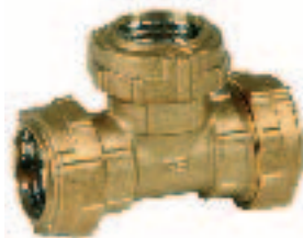
Ref. 0032 Тройник "T" triple coupling connector