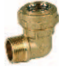
Ref. 0042 "L"-образный отвод с наружной резьбой. Male "L" elbow connector