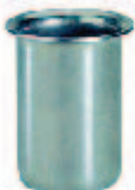
Ref. 0055 Наконечник из нержавеющей стали Stainless Steel Nozzle