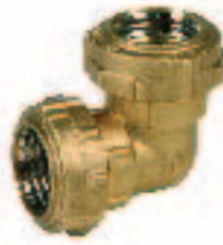
Ref. 0052 Соединение "L"-образный отвод. "L" elbow coupling connector