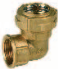
Ref. 0047 "L"-образный отвод с внутренней резьбой. Female "L" elbow connector