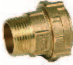
Ref. 0017 Прямое соединение с наружной резьбой. Straight male connector.