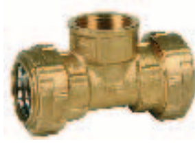
Ref. 0037 Тройник с внутренней резьбой. Female "T" connector