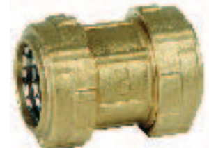
Ref. 0022 Соединительное прямое звено Straight coupling connector