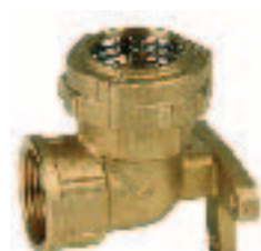
Ref. 0052 Соединение "L"-образный отвод. "L" elbow coupling connector