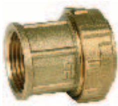
Ref. 0012 Прямое соединение с внутренней резьбой Straight female connector

Connector, PN-16, full bore. Body and cap made in hot forging brass according to DIN 17660. Pipe connection by means Genebre's design press system "Rac-Ge". Press ring made in special brass with superficial treatment. Working temperature since -20°C to +110°C. Adaptable for polyethylene pipes joint of low, medium and high density.