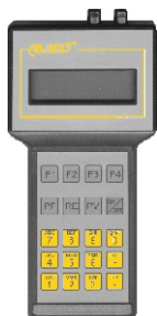
Коммуникатор KAP производства Аплисенс